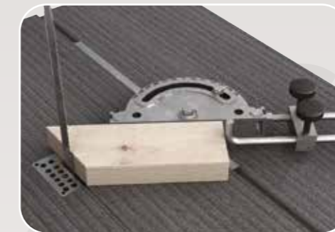
Piano scanalato con squadro per tagli angolari Table rainurée avec guide pour coupes angulaires Grooved table with mitre fence Tisch mit Nute und Anschlag für Winkelschnitte Mesa con ranura y guía para cortes angulares