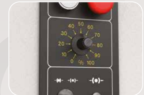
Inverter 3,5 ÷8 m/s Inverseur 3,5 ÷8 m/s Inverter 3,5 ÷8 m/s Wechselrichter 3,5 ÷8 m/s Inversor 3,5 ÷8 m/s