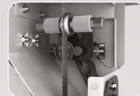
Guidalame inferiore di alta precisione Guidalame inférieur de haut précision High-precision bottom blade guide Hochpräzisions obere Blattführung Guía-sierra inferior de alta precisión