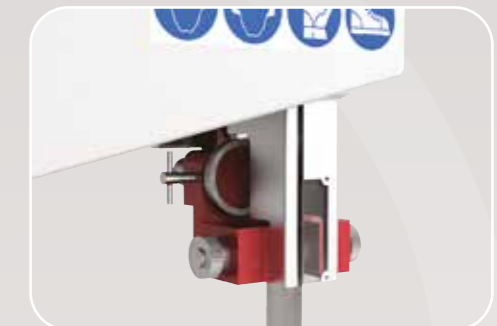
Guidalame superiore e inferiore di alta precisione APA II Guidalame supérieur et inférieur de haut précision APA II High-precision top and bottom blade guide APA II Hochpräzisions obere und obere Blattführung APA II Guía-sierra superior y inferior de alta precisión APA II